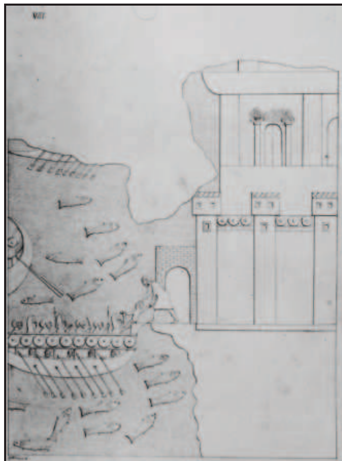
Fig. 3. Tiro en un relieve del palacio de Sennaquerib en Nínive.