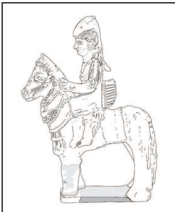
Fig. 1. Figura de terracotta hallada en Biblos (s. VIII-VI a.n.e.) (dibujo de Ramón Álvarez).