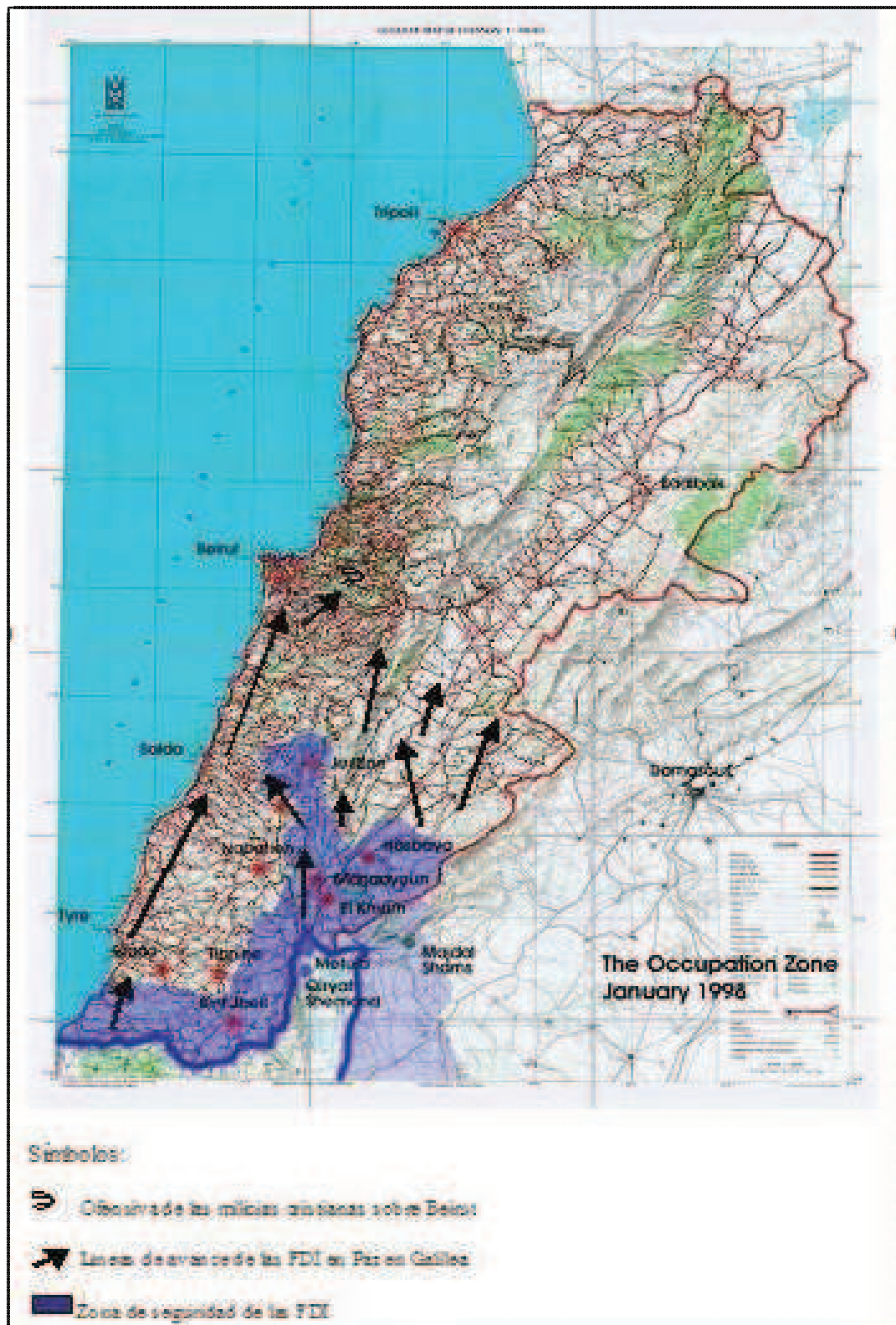
Mapa 1. Operación Paz en Galilea 1982 y zona de seguridad israelí (1985).